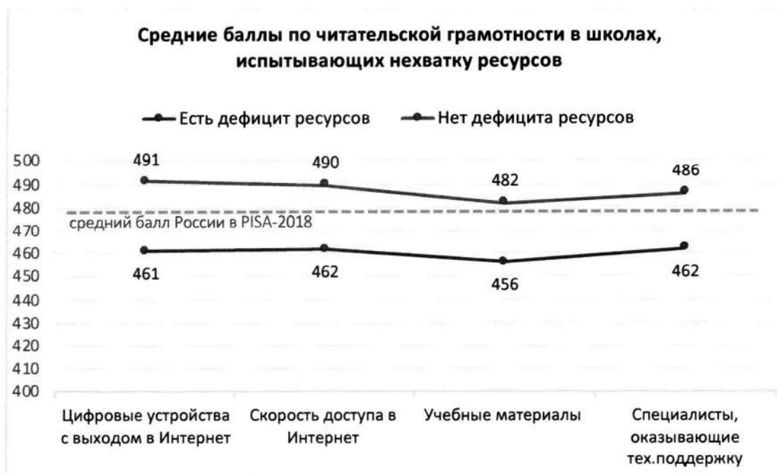
Рисунок 2. Дефициты ресурсов образовательной организации и результаты обучающихся по шкале читательской грамотности PISA относительно среднего результата РФ в PISA-2018

Дефициты ресурсов определялись на основании ответов администрации школ на вопросы анкеты и могут отражать субъективную точку зрения директора.